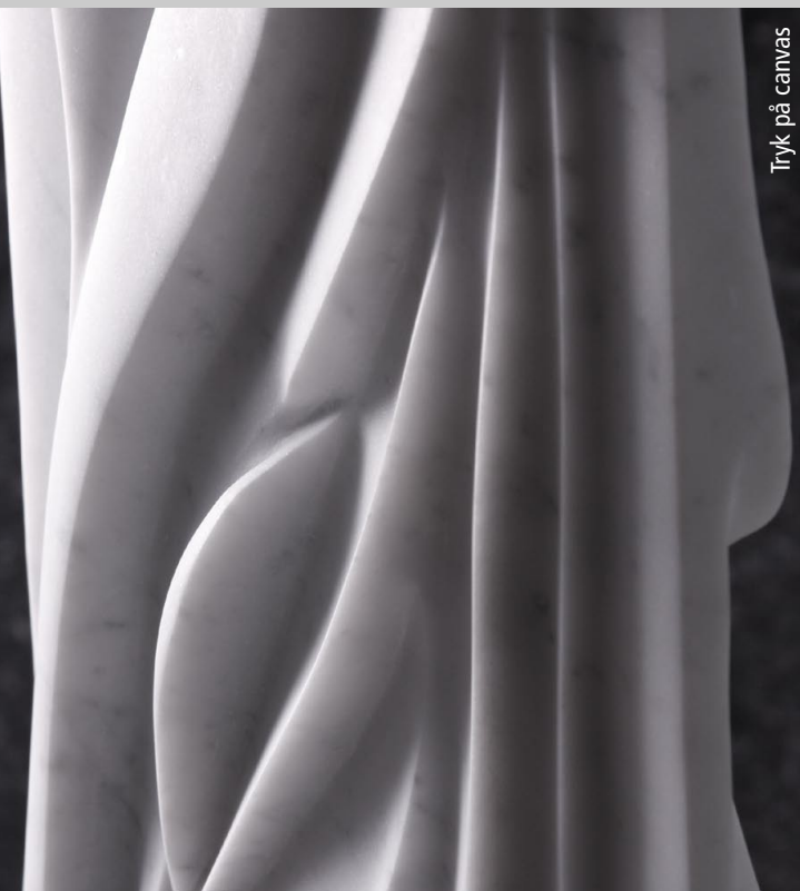
Tryk på canvas

Se mere på www.lisbethkrag.dk Eller ring til mig på 40 33 59 48