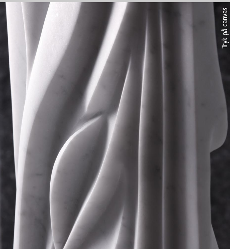
Tryk på canvas